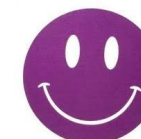
Animatrice /teur En cours de recrutement