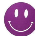
Animatrice /teur En cours de recrutement