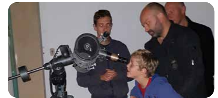
Les familles ont pu observer le ciel pour la nuit des étoiles.