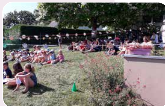
Les enfants rassemblés sous leurs guirlandes de soleil lors de la célébration de fin d'année.