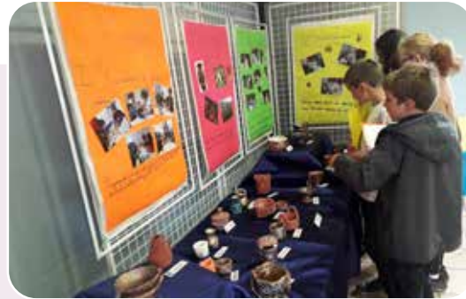
Les élèves de CE2-CM admirent l'exposition de l'ACAST dont leurs réalisations.

Avant de commencer une nouvelle année scolaire revenons sur les derniers jours de l'année 2018-2019 :