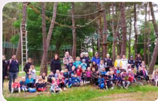
Journée « nature » et sportive à Trémelin pour les maternelles - CP.