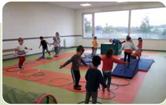
La grande salle de motricité avec sa grande baie vitrée et son sol pédagogique bicolore ont conquis les enfants.