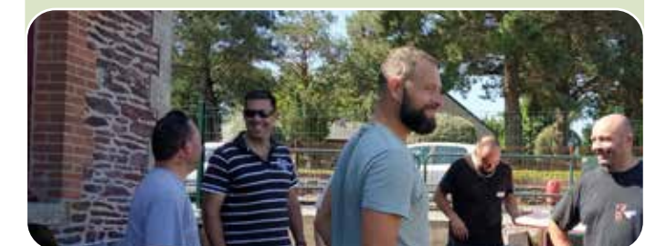
ça déménage à l'école « Saint Joseph » !

Cette rentrée a été marquée aussi par la livraison de l'extension du bâtiment maternelle, qui se voit doté d'une nouvelle salle de motricité et d'une salle d'activités pour les enfants, mais aussi d'un bureau de direction et d'une salle de réunion. Les deux mois d'été ont été bien remplis pour les bénévoles (parents et amis) avec plusieurs interventions (déménagement, nettoyage, tri, bricolage, installation du réseau informatique...).